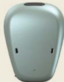
Baha® 6 Max